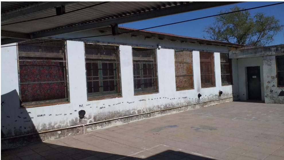
Reemplazo de carpinterías