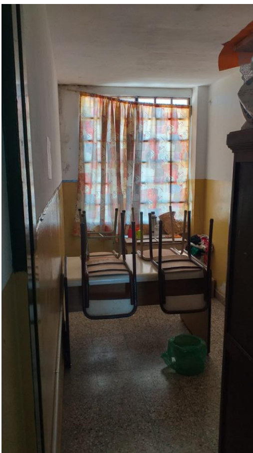
ESPACIO DESTINADO A NUEVOS BAÑOS