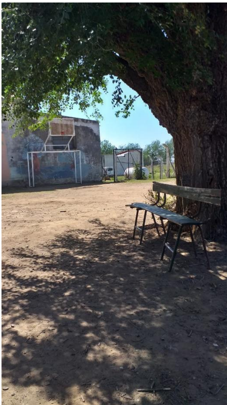
Retiro de árbol