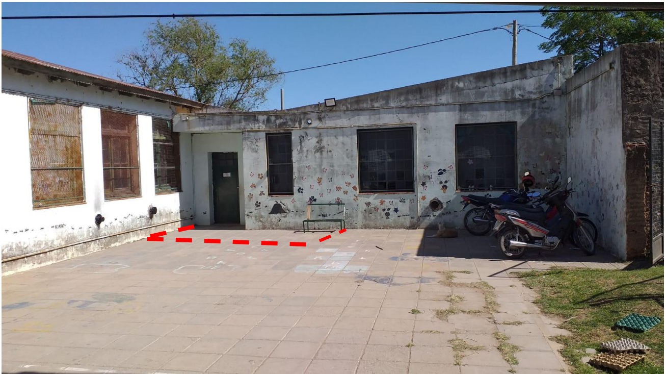
UBICACIÓN DE NUEVOS BAÑOS PRIMARIA