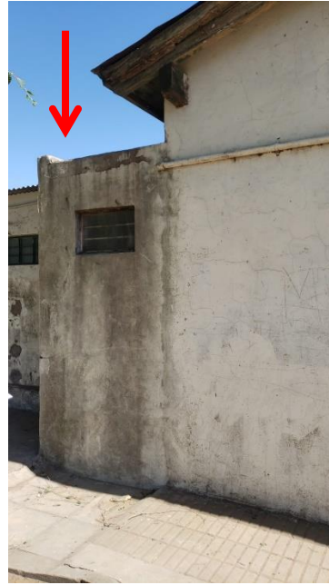
Demolición de losa canaleta