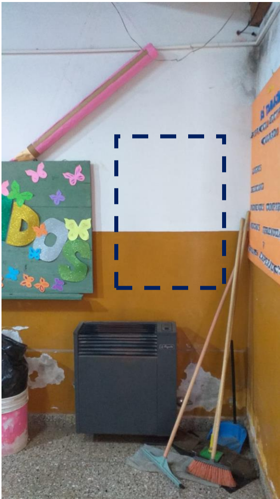
VISTA INTERIOR INCORPORAR PAÑO FIJO (PRIMARIA)