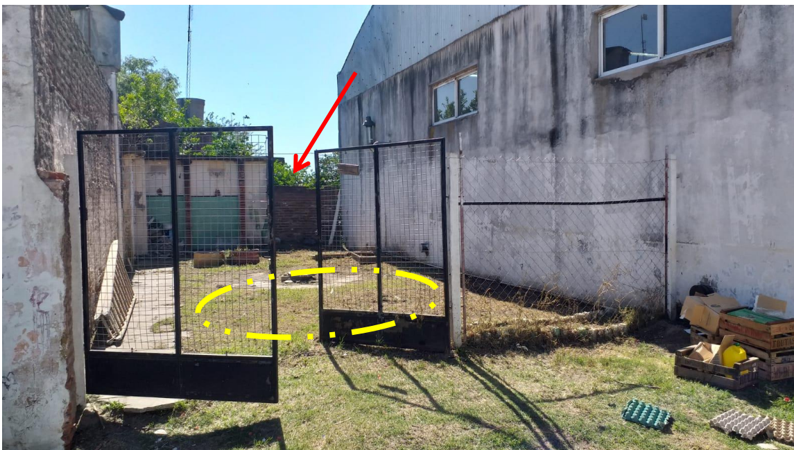
MURO MEDIANERO A DEMOLER Y A CONSYTRUIR EN BLOQUES DE HORMIGON ESPACIO PARA NUEVO BIODIGESTOR