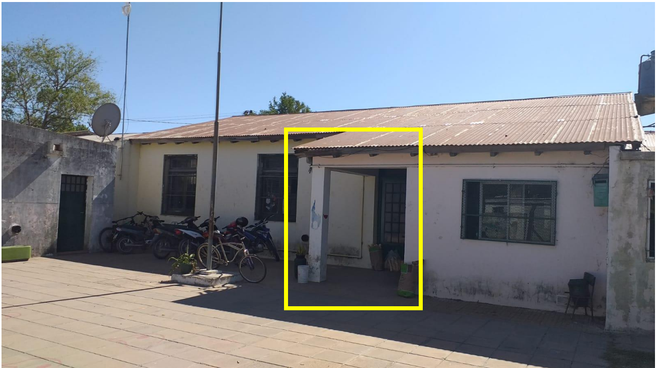
GALERIA A INCORPORAR COMO ESPACIO DE USO DE AREA ADMINISTRATIVA