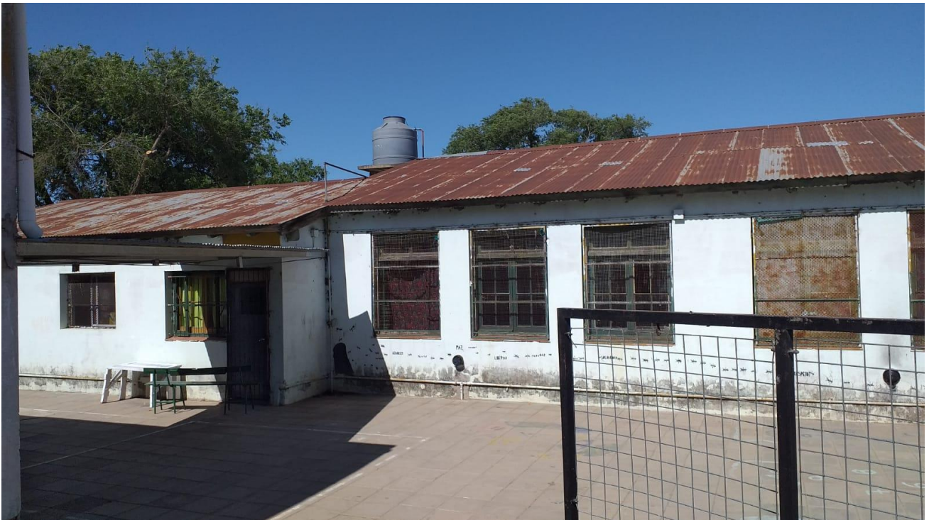
ESTADO DE LAS CUBIERTAS