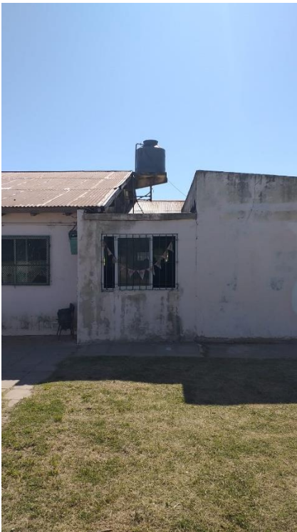
UNICO DE TANQUE DE RESERVA