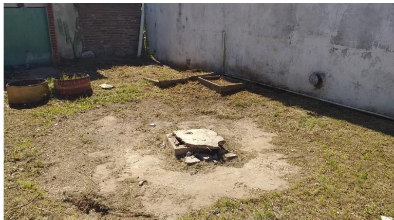
Cegado de pozos