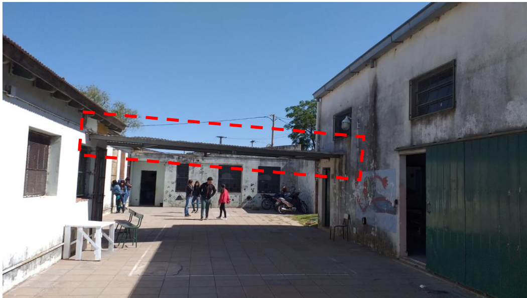
Extracción de conector entre Escuela Secundaria y cocina