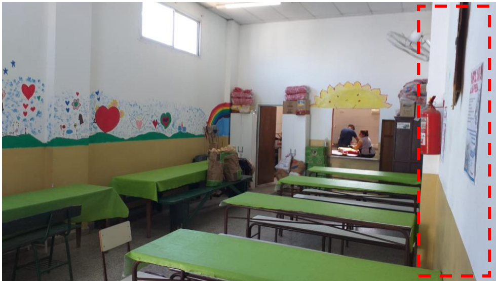
Demolición de mampostería divisoria