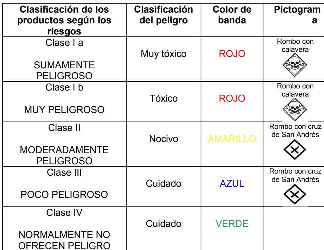
Tabla 1. Clasificación toxicológica según riesgos y valores de DL50 de productos formulados.

En anexo XI se detallan los productos clase IV, autorizados por SENASA.